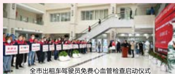
全市出租车驾驶员免费心血管检查启动仪式

5月9日上午,宝鸡高新医院启动“情系出租车驾驶员 免费心血管高危人群筛查与综合干预项目”,为全市出租车驾驶员免费进行心血管相关检查活动。