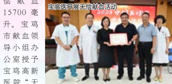
宝高医开展无偿献血活动