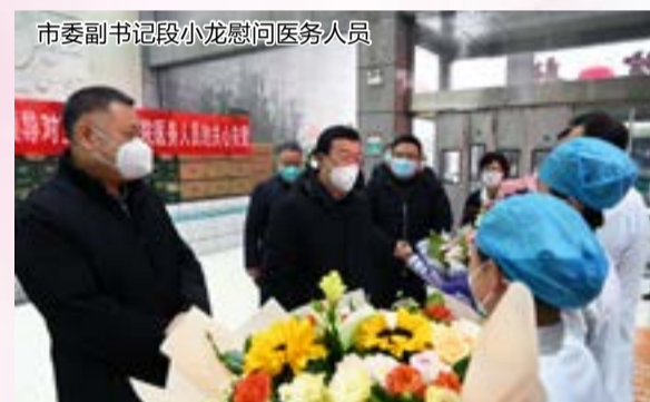
市委副书记段小龙慰问医务人员

1月10日下午，中共宝鸡市委副书记段小龙，市人大常委会副主任、市总工会主席陈小平，市卫健委副主任邓峰一行莅临宝鸡高新医院，慰问一线医务人员。