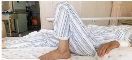
术后第二天,韩阿姨可主动活动腿关节。