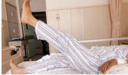
术后第三日,韩阿姨可进行主动直腿抬高锻炼。