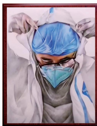
画面上的医务工作者，正在小心翼翼地按照步骤认真穿着防护服，接下来的时间里，他将身着厚重的防护装备，在“铠甲”的保护下，开展医疗救治工作……