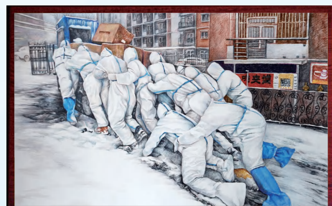
十多名医务工作者，身穿厚厚的防护服，在冰天雪地里，相互扶持，推着一辆三轮车上坡运送防疫物资。他们身上白色的防护服与茫茫雪景融为一体，他们集合力量躬身而行，跌倒、爬起，一路搀扶、一路向前……