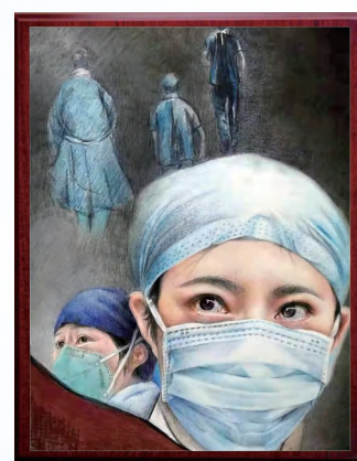
带着防护口罩的医务人员露出一双清澈的眼睛，目光坚定，满怀希望地望向前方，似在告诉人们一定能战胜疫情的决心……