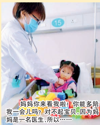
妈妈你来看我啦! 你能多陪我一会儿吗? 对不起宝贝,因为妈妈是一名医生,所以……