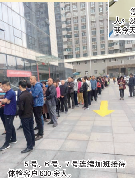
5号、6号、7号连续加班接待 体检客户600余人。