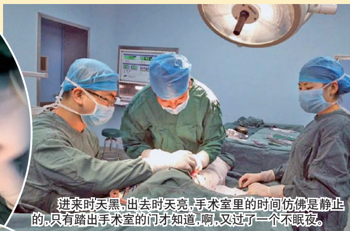
进来时天黑,出去时天亮,手术室里的时间仿佛是静止的,只有踏出手术室的门才知道,啊,又过了一个不眠夜。