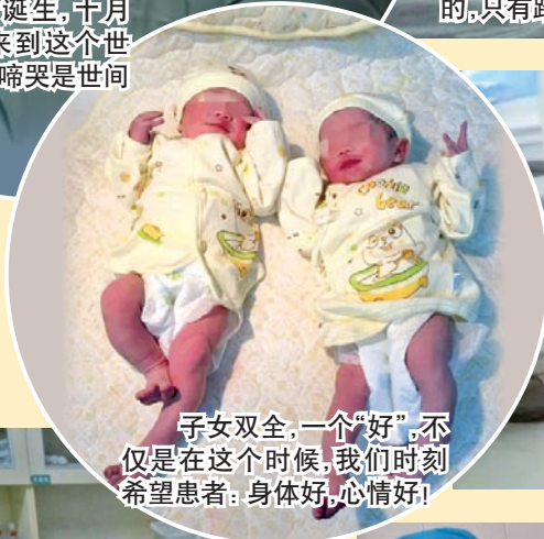
子女双全,一个“好”,不 仅是在这个时候,我们时刻 希望患者:身体好,心情好!