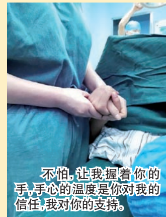
不怕,让我握着你的手,手心的温度是你对我的信任,我对你的支持。