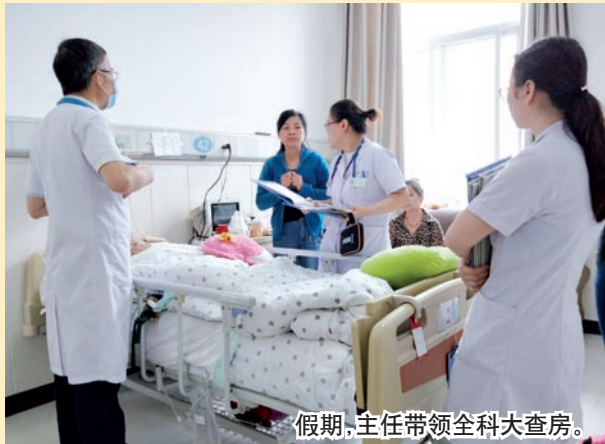
假期,主任带领全科大查房。