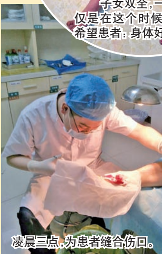
凌晨三点,为患者缝合伤口。