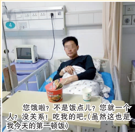
您饿啦? 不是饭点儿? 您就一个人? 没关系! 吃我的吧。(虽然这也是我今天的第一顿饭)