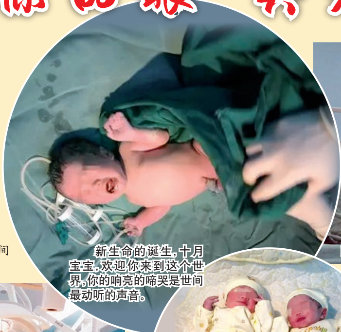
新生命的诞生,十月 宝宝,欢迎你来到这个世界, 你的响亮的啼哭是世间 最动听的声音。

十一小长假结束了 对很多人来说 十一小长假是个放松的好机会 跟家人出游 与朋友聚会 即使宅在家 也是一种简单的快乐 但是 十一期间 宝鸡高新人民医院的医护人员们 仍旧坚守岗位 服务患者 我们用影像记录下这些动人的瞬间