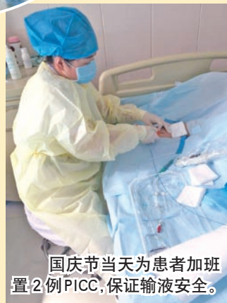
国庆节当天为患者加班 置2例PICC,保证输液安全。