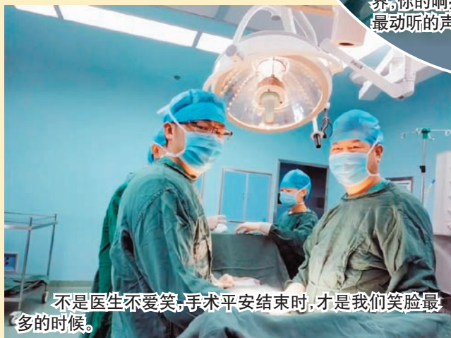
不是医生不爱笑,手术平安结束时,才是我们笑脸最多的时候。