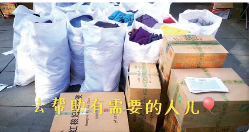
去帮助有需要的人儿

旧衣堆积在角落 占用了我们的生活空间 扔掉,太浪费太可惜! 垃圾回收、填埋、烧掉不忍心! 而此时此刻,在这个寒冷的冬日,远在偏远山区的孩子们仍穿着破旧的衣服,蜷缩在教室里,刻苦学习,而孩子原本应该稚嫩的双手,却因寒冷,冻得满是皲裂的冻疮... 这条爱心捐赠通知在医院工作群中一经发出,我院员工便在领导的带领